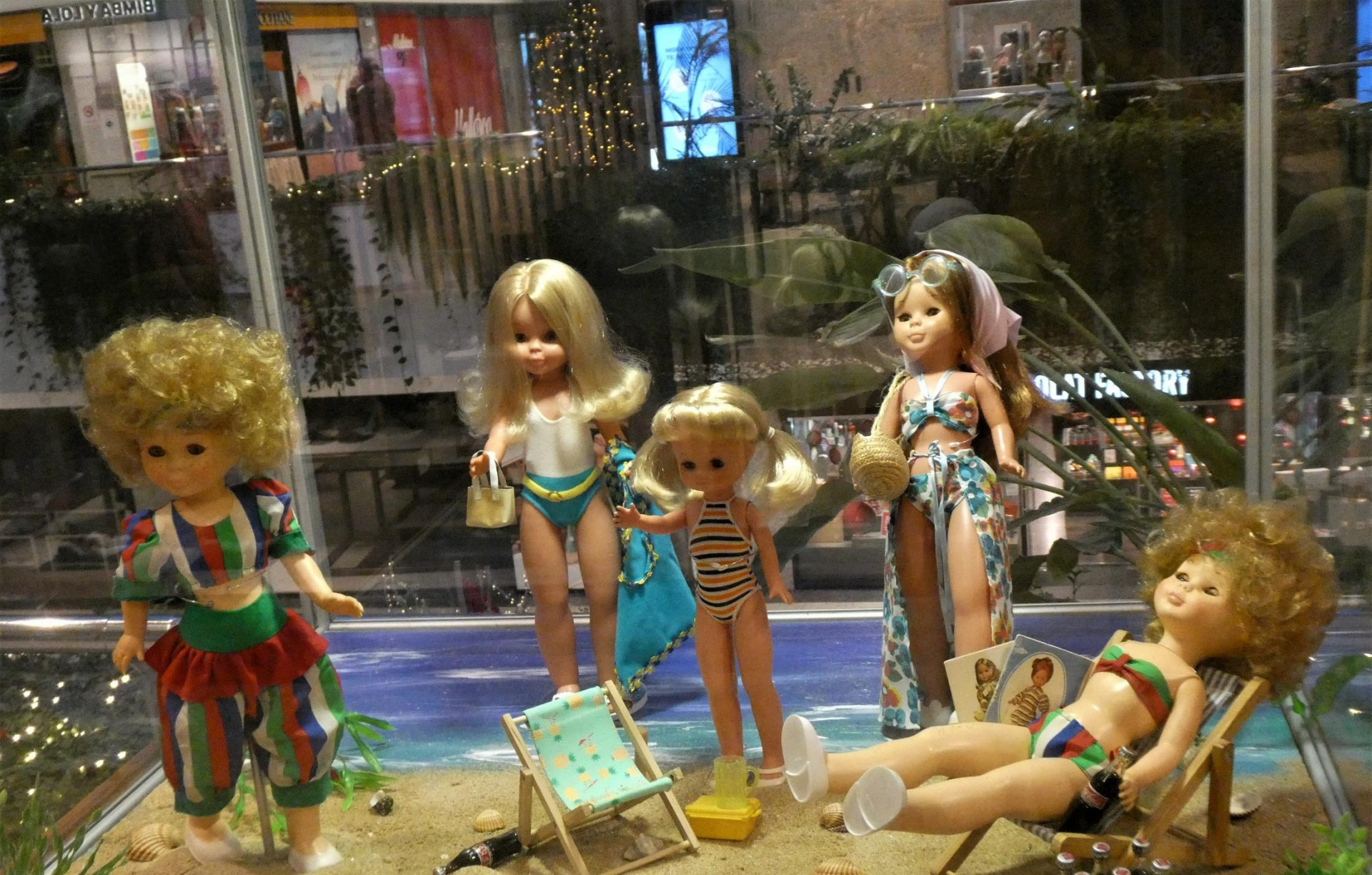
A finales de los años 90 aparece “Nancy Maniquí”, un poco más pequeña y con menos curvas, que vistió Agatha Ruiz de la Prada.