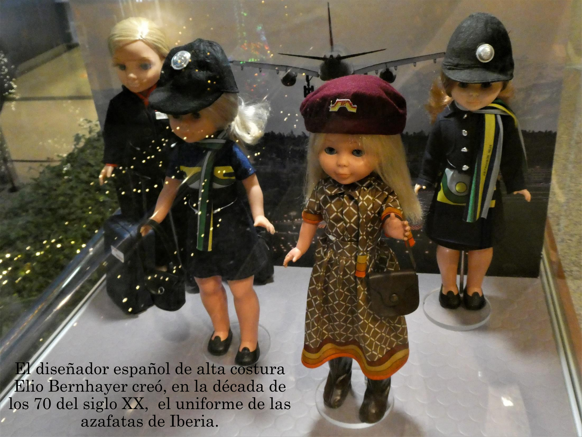
El diseñador español de alta costura Elio Bernhayer creó, en la década de los 70 del siglo XX, el uniforme de las azafatas de Iberia.