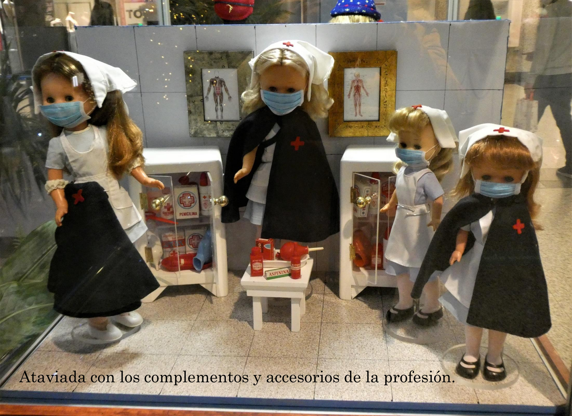
Ataviada con los complementos y accesorios de la profesión.