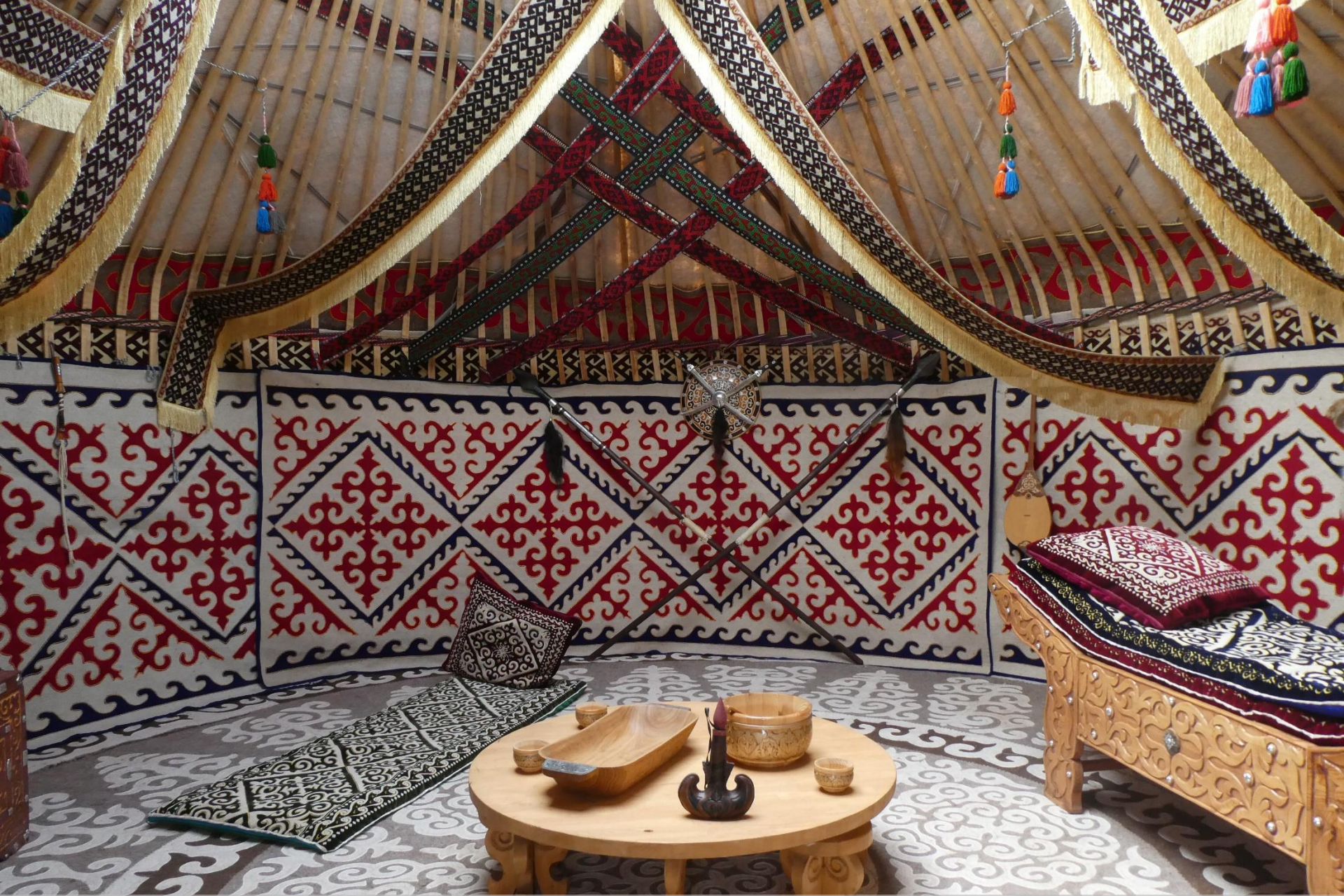
Todas las telas que envuelven la estructura de madera están realizadas con lana de oveja prensada, tejida y teñida a mano.