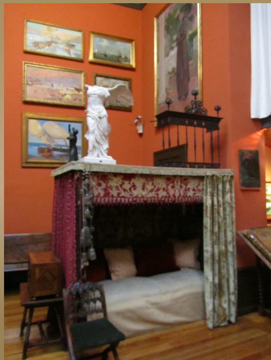
Distintos ambientes de su estudio.