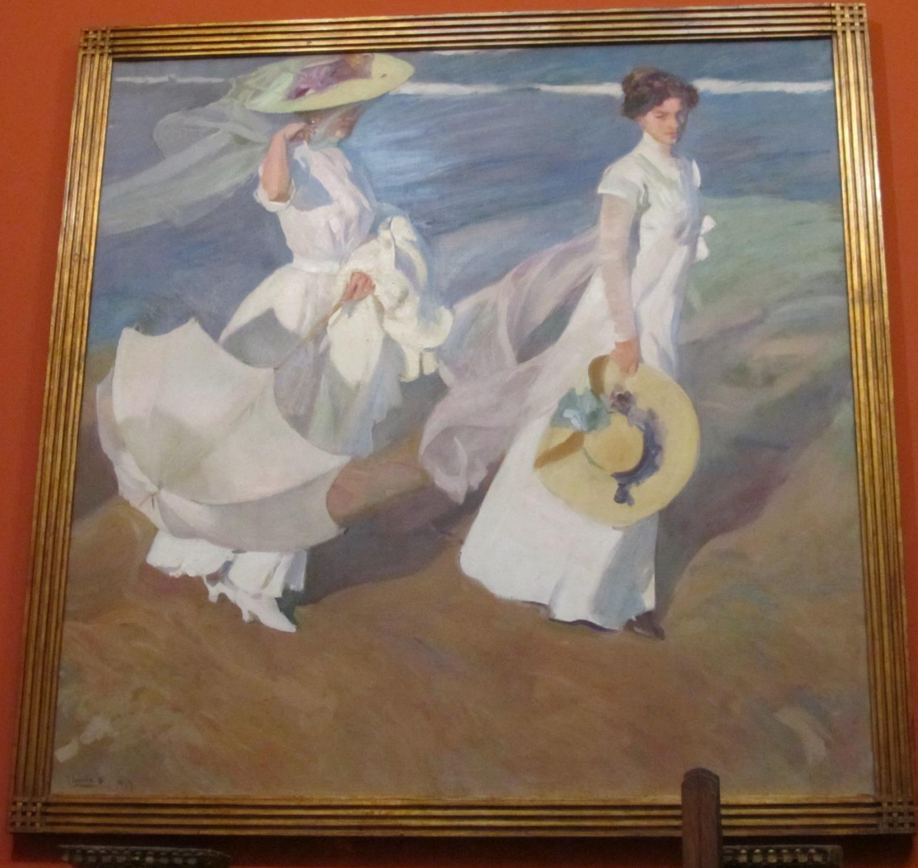
Paseo a orillas del mar, 1909.