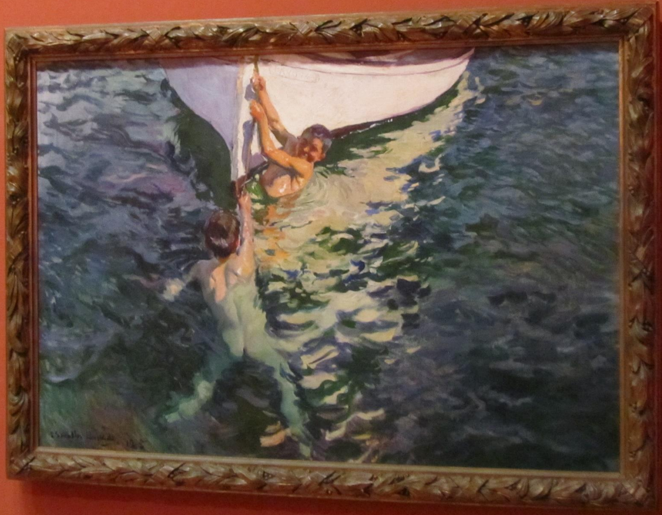
El bote blanco, 1905.