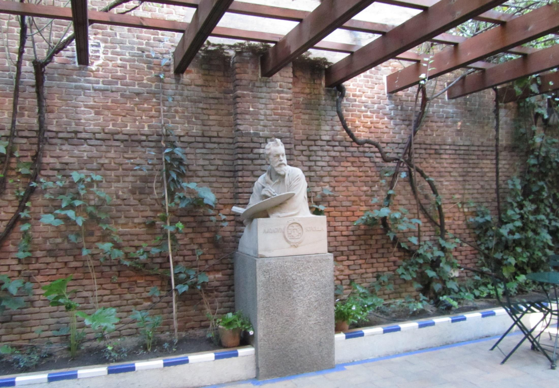
Frente a dicha alberca hay una pérgola de influencia italiana, presidida por el busto del pintor.