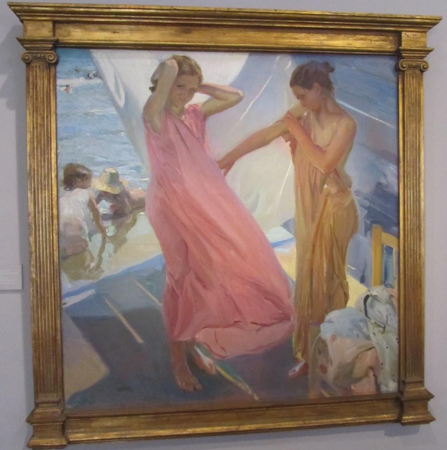
Después del baño, 1911.