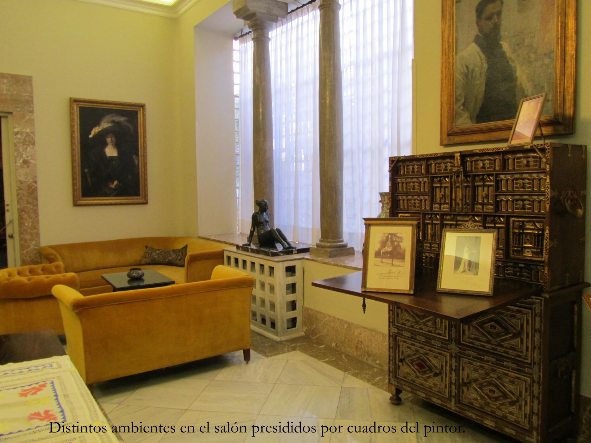
Distintos ambientes en el salón presididos por cuadros del pintor.