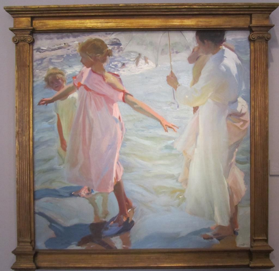
La hora del baño Valencia, 1909.