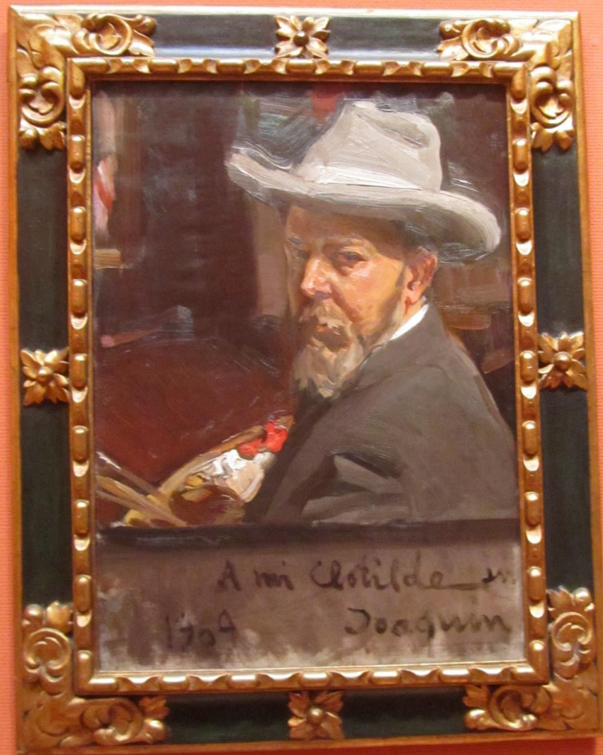
Autorretrato, dedicado a su esposa, 1904.

La segunda sala la empleaba el pintor para colgar las últimas obras realizadas y las que tenía a la venta.