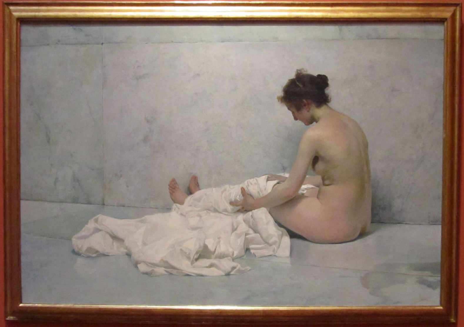
Después del baño, 1892.

La sala de acceso es el primero de los tres estudios encadenados que el artista tenía. En vida de Sorolla, se usaba para almacenar marcos y lienzos.