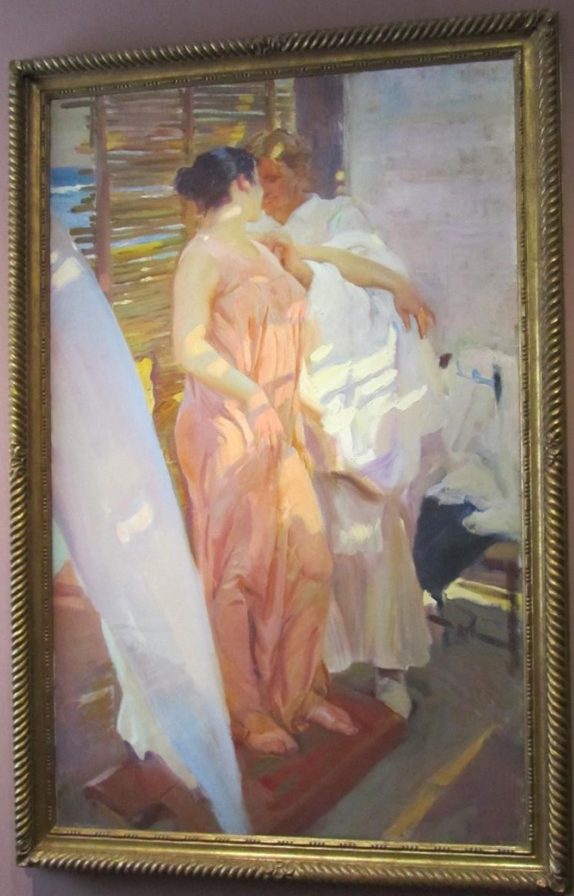
Después del baño o La bata rosa Playa de Valencia, verano de 1916.