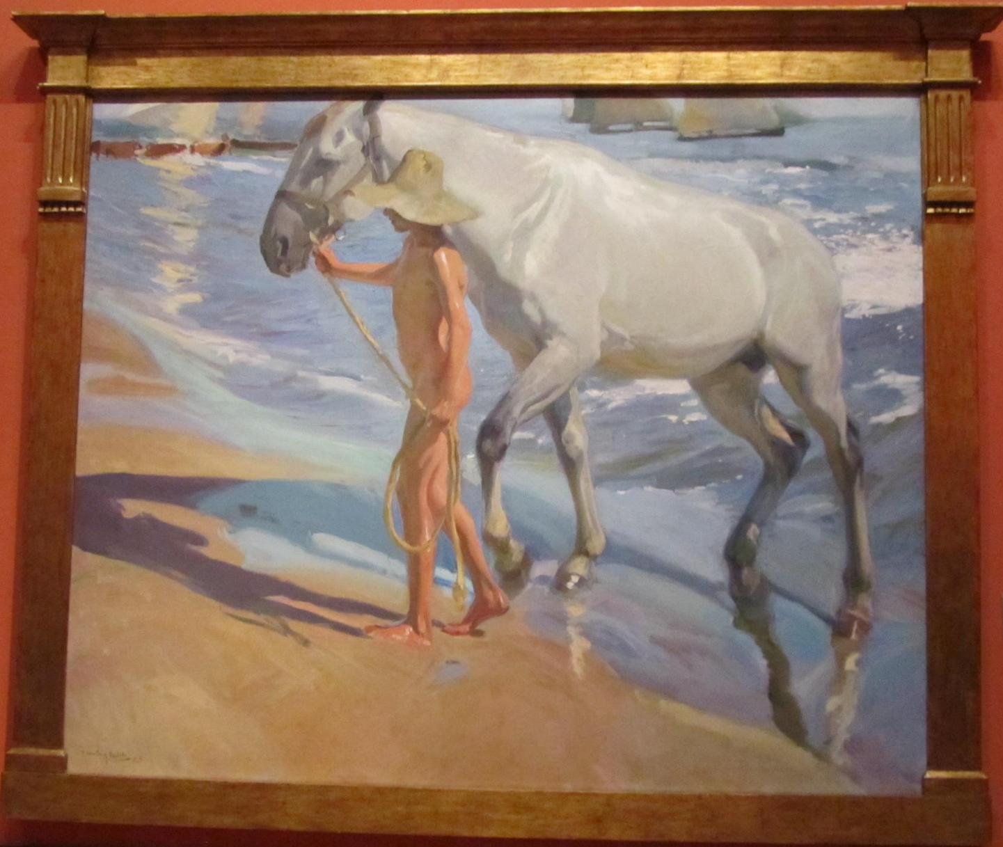
El baño del caballo, 1909.